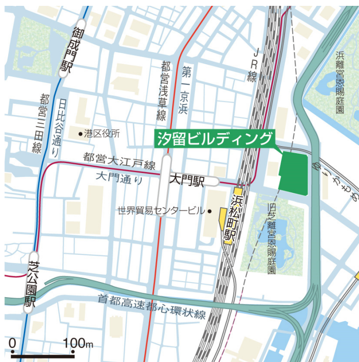
(参考) 汐留ビルディング 案内図、外観写真