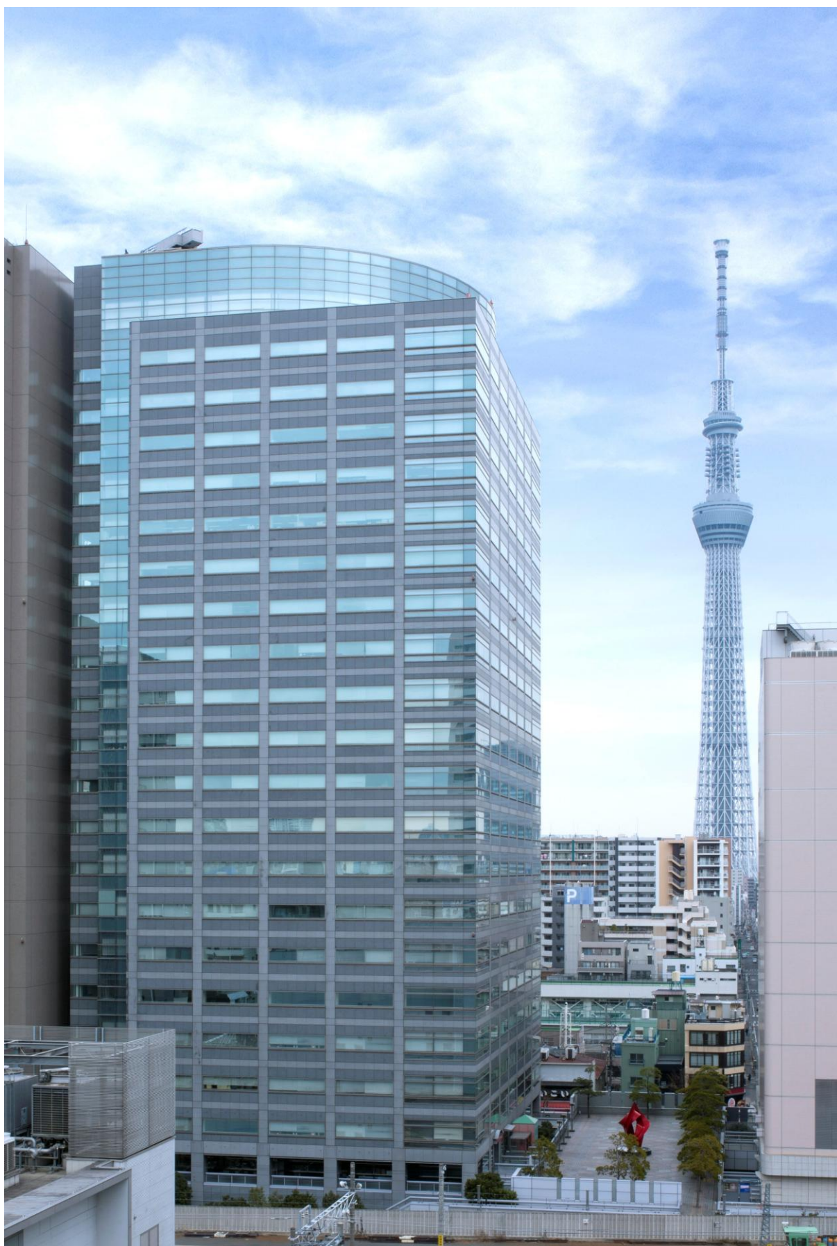
<参考資料1>アルカセントラル 外観写真