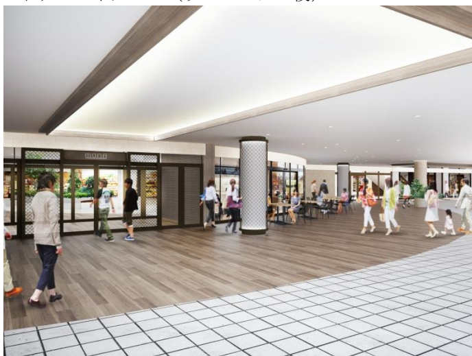
エントランスイメージ（リニューアル後）（注）