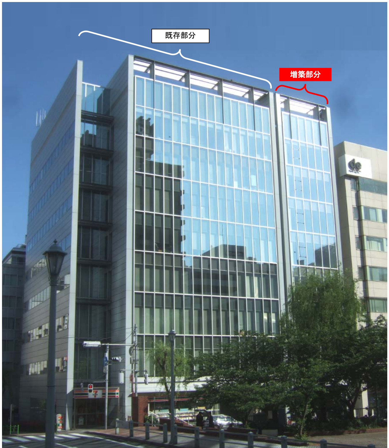
(参考) 菱進銀座イーストミラービル外観写真 (増築工事竣工後)