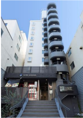
D38 ホテルマイステイズ心齋橋