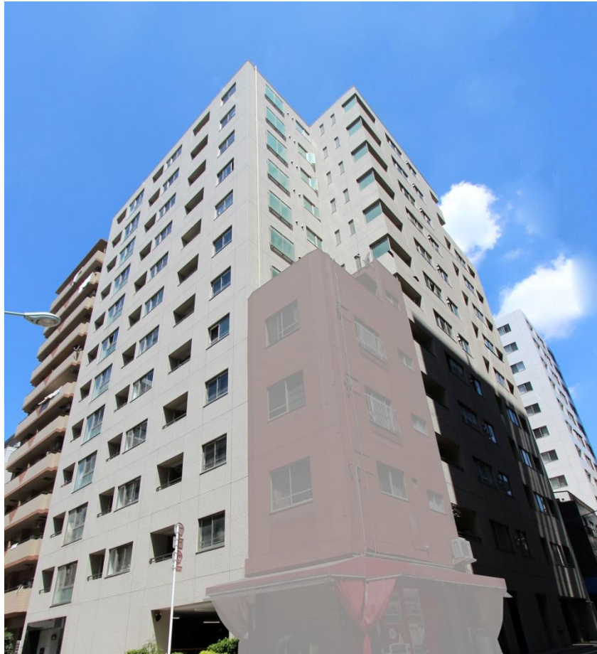
(写真中央4階建の建物は取得予定資産ではありません。)