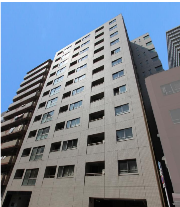
(取得予定資産南側から撮影)