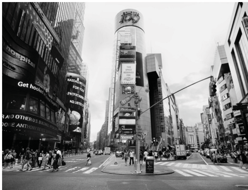
Times Square, 109 (2010) [ニューヨーク、東京]