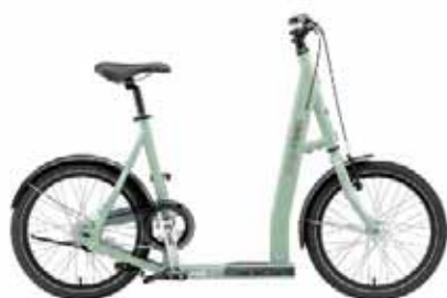
「LOUISGARNEAU SKUBY 1」