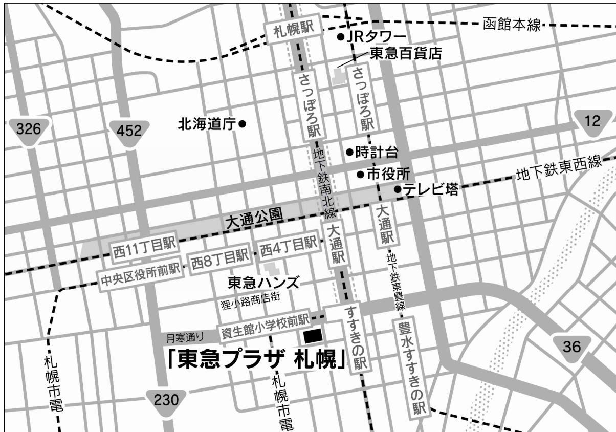
(UR-8) 東急プラザ 札幌 周辺地図

ご注意：本報道発表文は、本投資法人の資産の取得に関して一般に公表するための文書であり、投資勧誘を目的として作成されたものではありません。投資を行う際は、必ず本投資法人が作成する新投資口発行及び投資口売出届出目論見書並びに訂正事項分をご覧頂いた上で、投資家ご自身の責任と判断でなさるようお願いいたします。 また、本報道発表文は、米国における証券の募集を構成するものではありません。1933年米国証券法に基づいて証券の登録を行うか又は登録の免除を受ける場合を除き、米国において証券の募集又は販売を行うことはできません。米国において証券の公募が行われる場合には、1933年米国証券法に基づいて作成される英文のプロスペクトスが用いられます。プロスペクトスは、当該証券の発行人又は当該証券の保有者より入手することができますが、これには発行人及びその経営陣に関する詳細な情報並びにその財務諸表が記載されます。なお、本件においては米国における証券の公募は行われません。