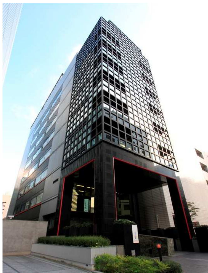
(T0-10) 品川プレイス 外観写真