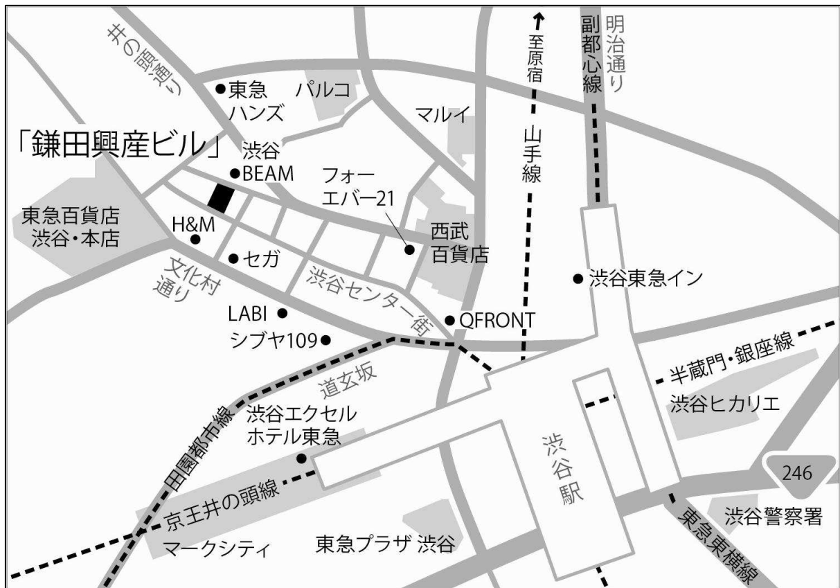
(UR-9) 鎌田興産ビル 周辺地図

ご注意：本報道発表文は、本投資法人の資産の取得に関して一般に公表するための文書であり、投資勧誘を目的として作成されたものではありません。投資を行う際は、必ず本投資法人が作成する新投資口発行及び投資口売出届出目論見書並びに訂正事項分をご覧頂いた上で、投資家ご自身の責任と判断でなさるようお願いいたします。 また、本報道発表文は、米国における証券の募集を構成するものではありません。1933年米国証券法に基づいて証券の登録を行うか又は登録の免除を受ける場合を除き、米国において証券の募集又は販売を行うことはできません。米国において証券の公募が行われる場合には、1933年米国証券法に基づいて作成される英文のプロスペクトスが用いられます。プロスペクトスは、当該証券の発行法人又は当該証券の保有者より入手することができますが、これには発行法人及びその経営陣に関する詳細な情報並びにその財務諸表が記載されます。なお、本件においては米国における証券の公募は行われません。