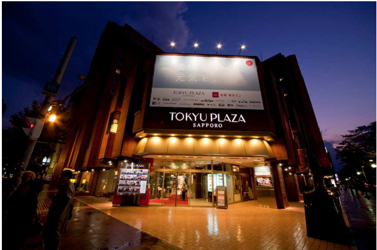
(UR-8) 東急プラザ 札幌 外観写真