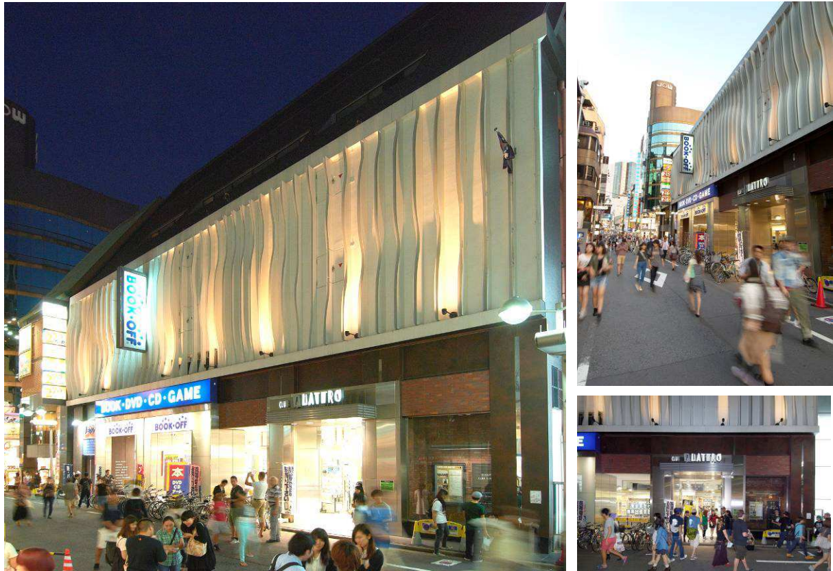
(UR-9) 鎌田興産ビル 外観写真

ご注意：本報道発表文は、本投資法人の資産の取得に関して一般に公表するための文書であり、投資勧誘を目的として作成されたものではありません。投資を行う際は、必ず本投資法人が作成する新投資口発行及び投資口売届出目論見書並びに訂正事項分をご覧頂いた上で、投資家ご自身の責任と判断でなさるようお願いいたします。 また、本報道発表文は、米国における証券の募集を構成するものではありません。1933年米国証券法に基づいて証券の登録を行うか又は登録の免除を受ける場合を除き、米国において証券の募集又は販売を行うことはできません。米国において証券の公募が行われる場合には、1933年米国証券法に基づいて作成される英文のプロスペクタスが用いられます。プロスペクタスは、当該証券の発行法人又は当該証券の保有者より入手することができますが、これには発行法人及びその経営陣に関する詳細な情報並びにその財務諸表が記載されます。なお、本件においては米国における証券の公募は行われません。