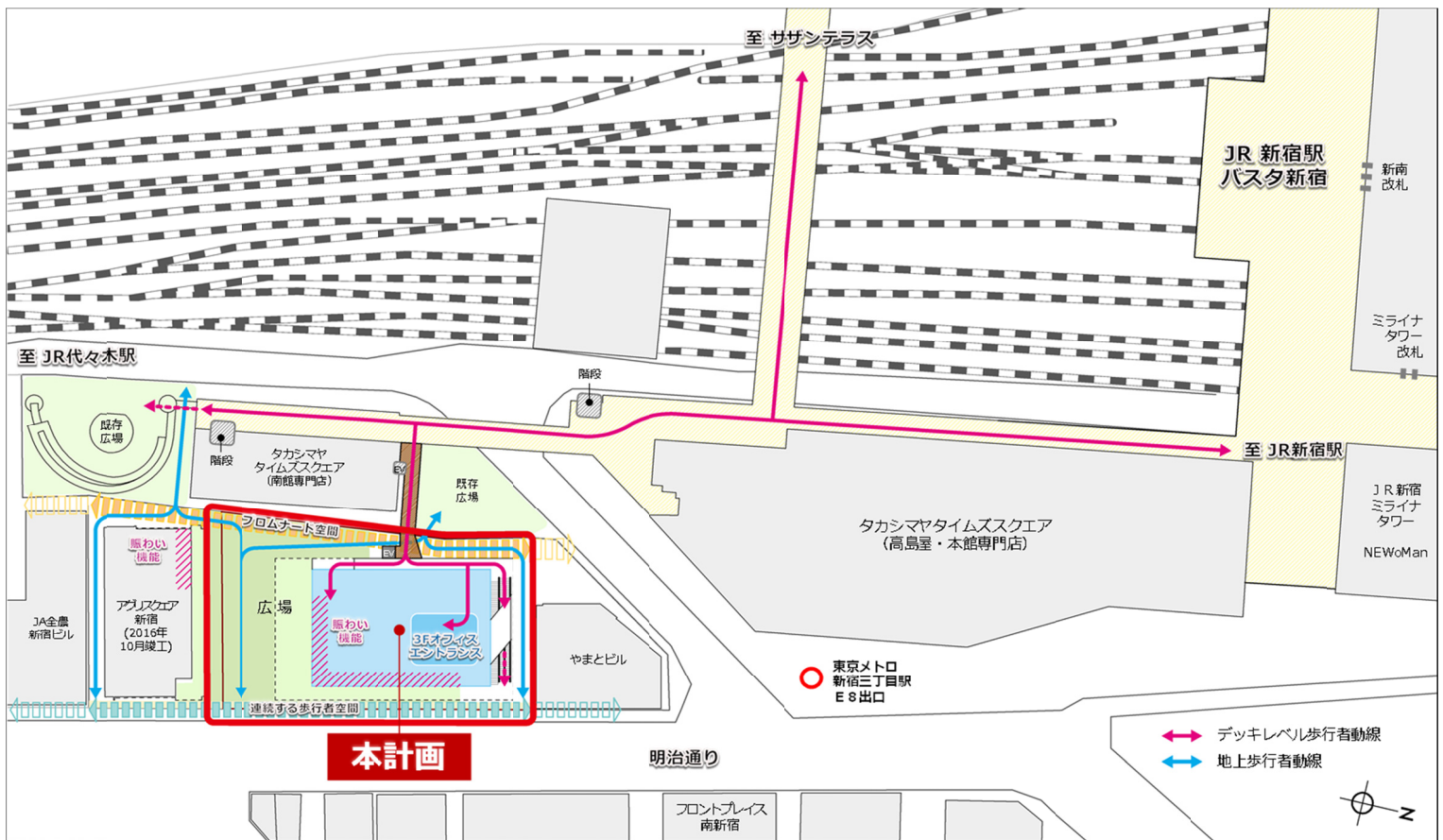
歩行者ネットワーク図