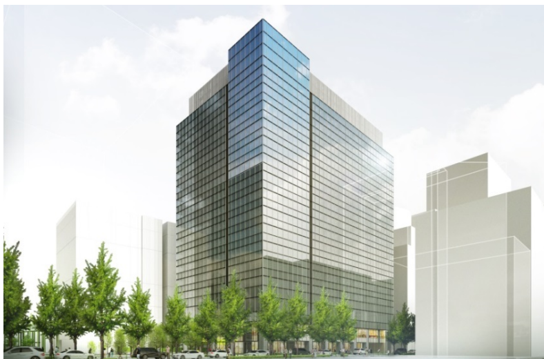
建物外観完成イメージ（明治通り側から）