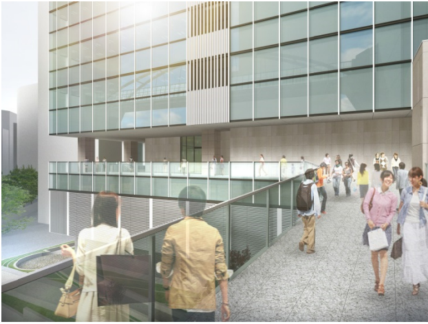
デッキアプローチイメージ (オフィスエントランス前)