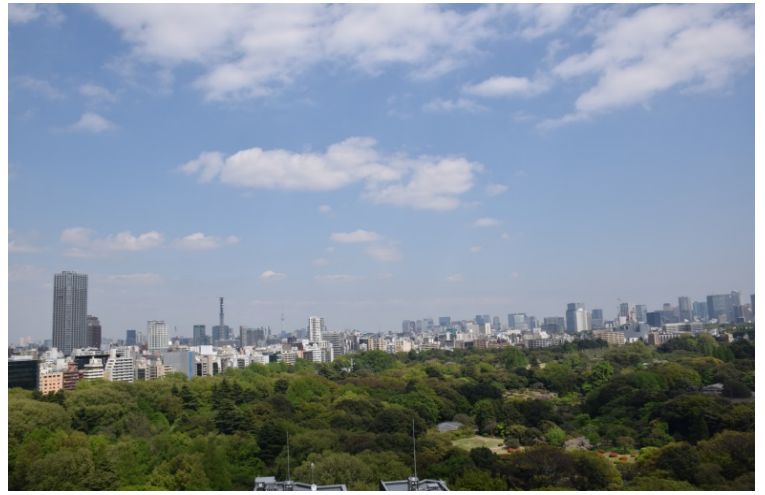
オフィス高層階からの眺望イメージ