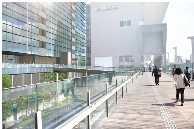
デッキ接続イメージ