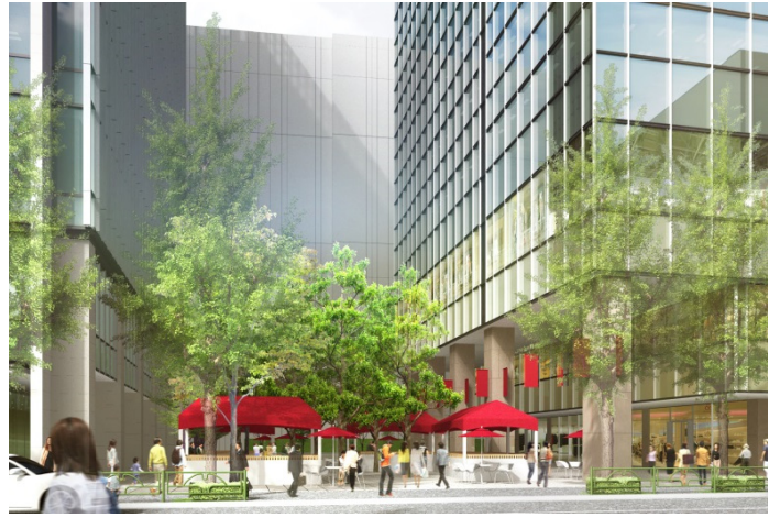
敷地内広場イメージ (アグリスクエア新宿との間)