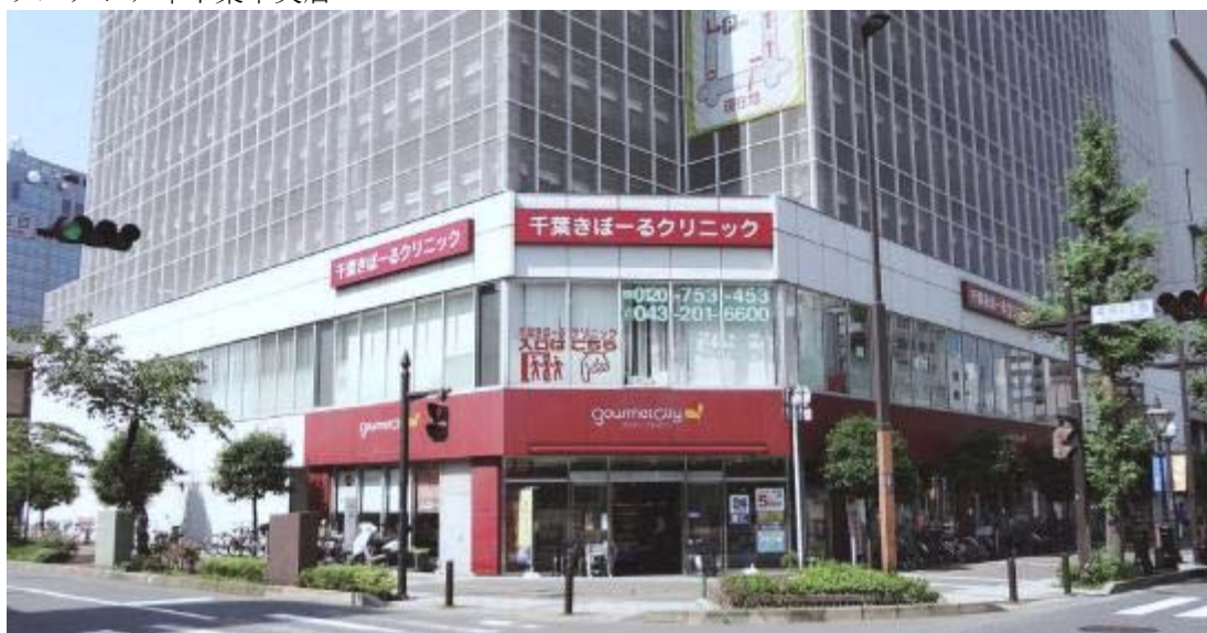
T-14 グルメシティ千葉中央店