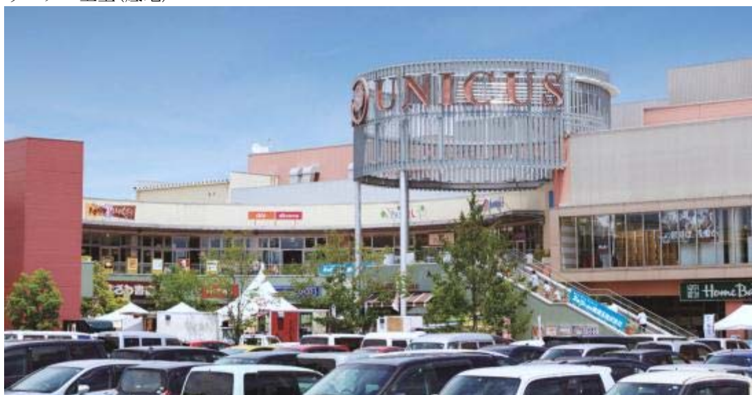
T-11 ウニクス上里(底地)