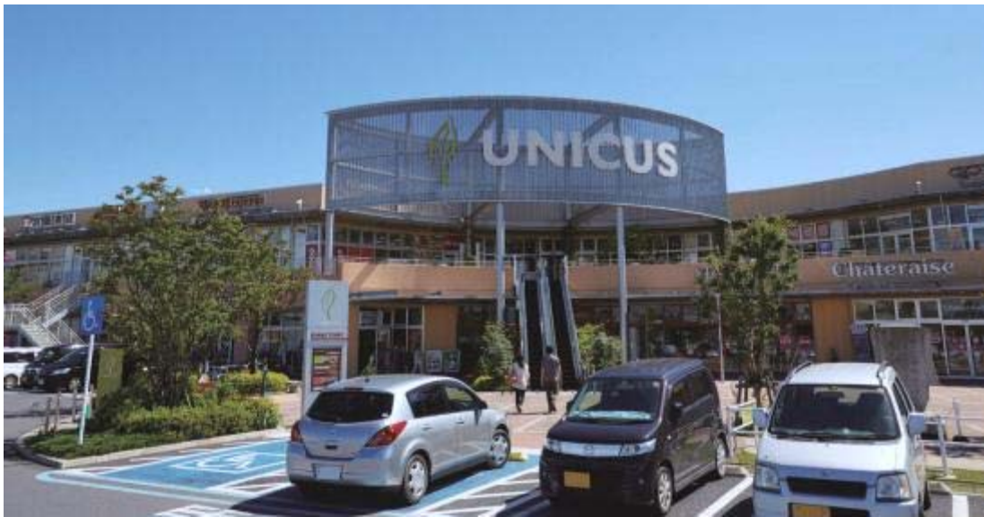
T-12 ユニクス鴻巣(底地)