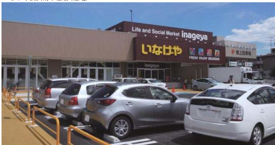
T-13 いなげや横浜南本宿店(底地)