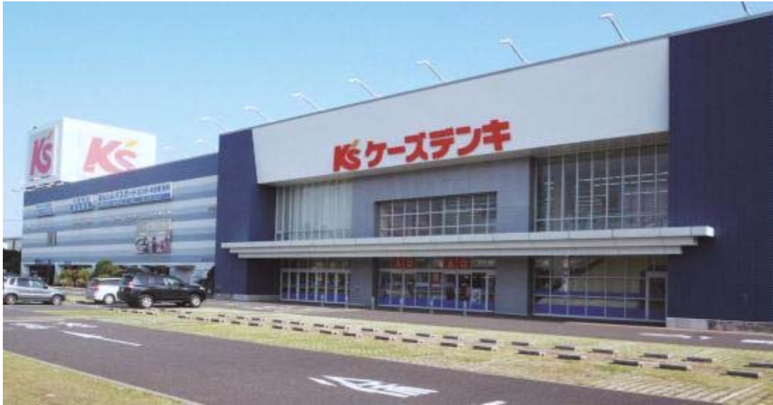
T-10 ケーズデンキ湘南藤沢店(底地)