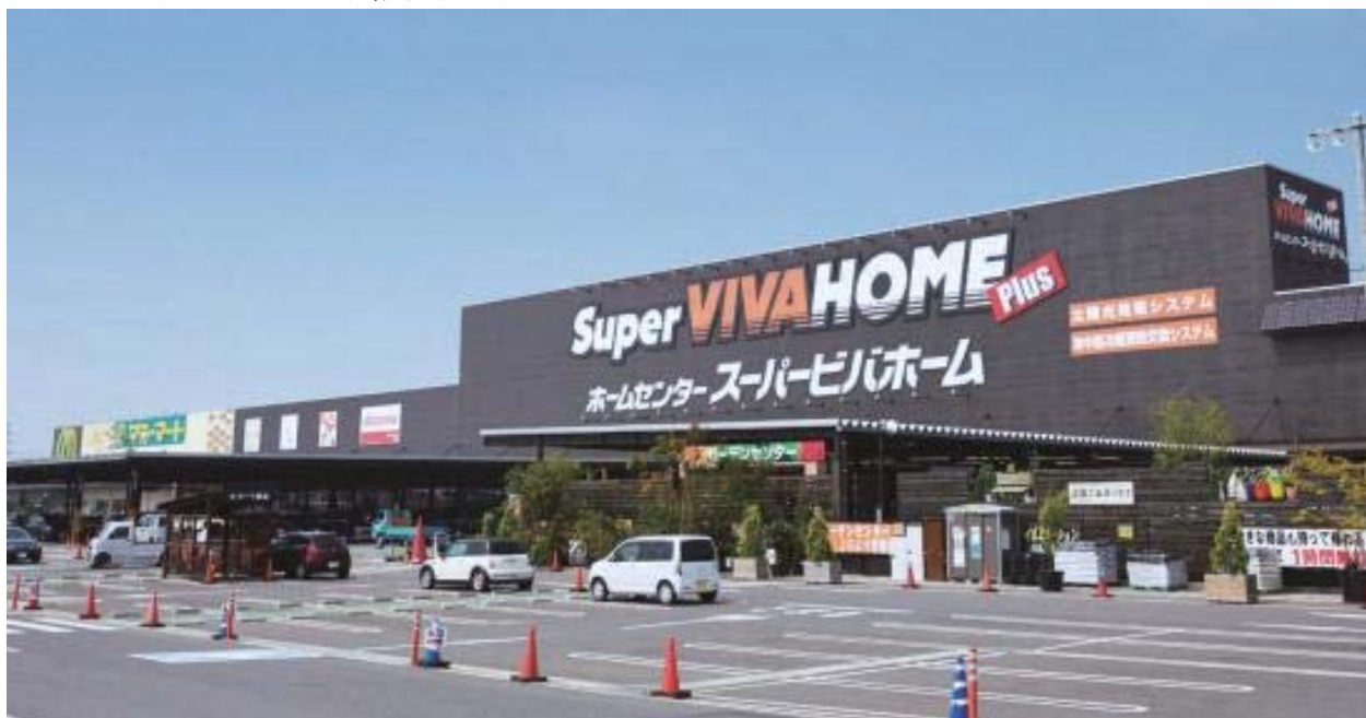
T-9 スーパービバホーム岩槻店(底地)