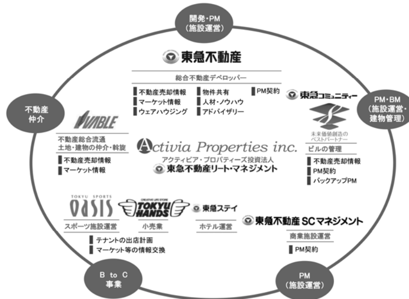
<東急不動産ホールディングスグループのバリューチェーン概念図>

以下は、東急不動産ホールディングスグループのバリューチェーンの概要を概念的に図示したものです。