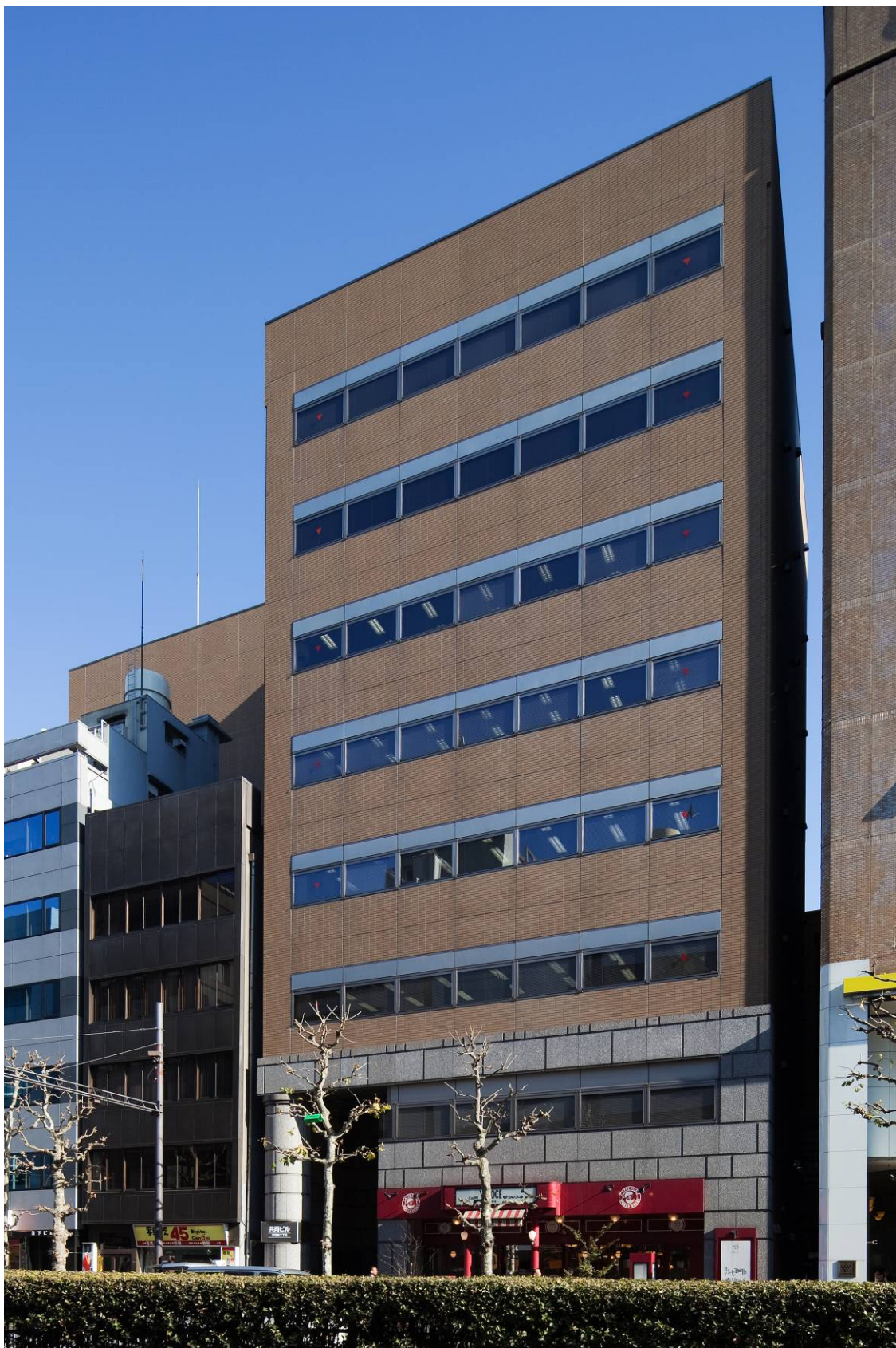
(参考) 共同ビル (茅場町2丁目) 外観写真