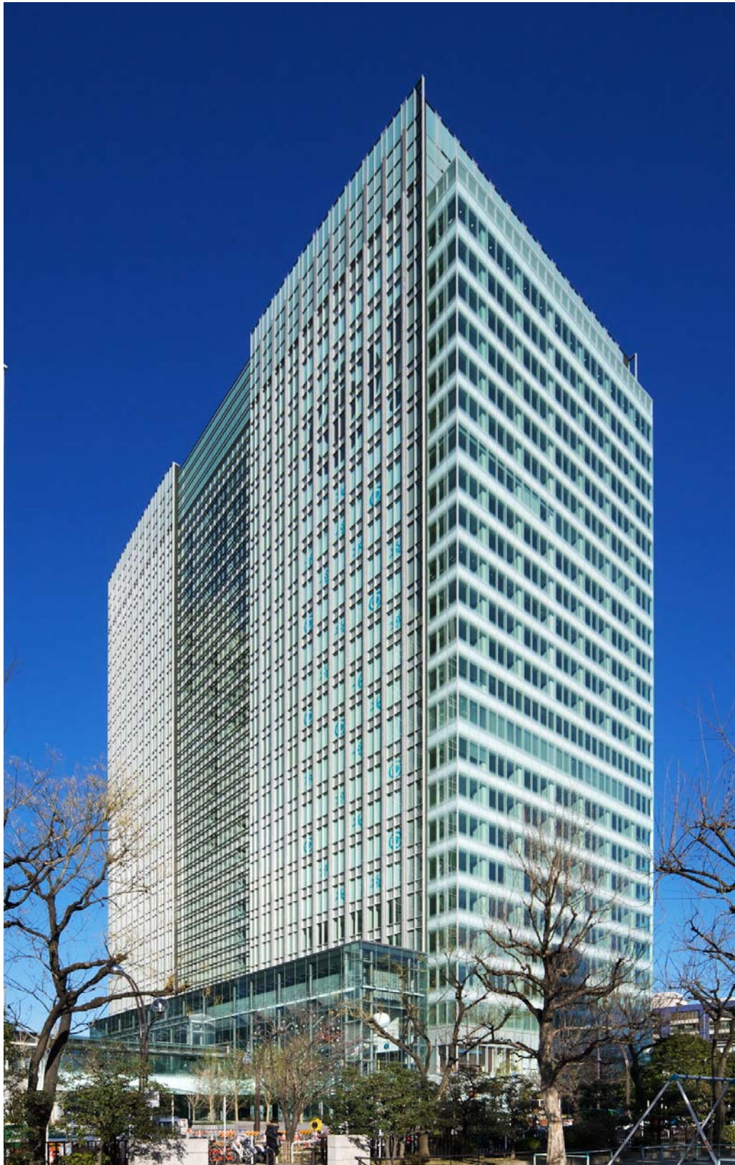
(参考) 汐留ビルディング外観写真

ご注意：この文書は、資産の取得について、一般に公表するための記者発表文であり、投資勧誘を目的として作成されたものではありません。投資を行う際は、必ず当投資法人が作成する新投資口発行及び投資口売出届出目論見書及び訂正事項分（作成された場合）をご覧頂いた上で投資家ご自身の判断でなさるようお願い致します。