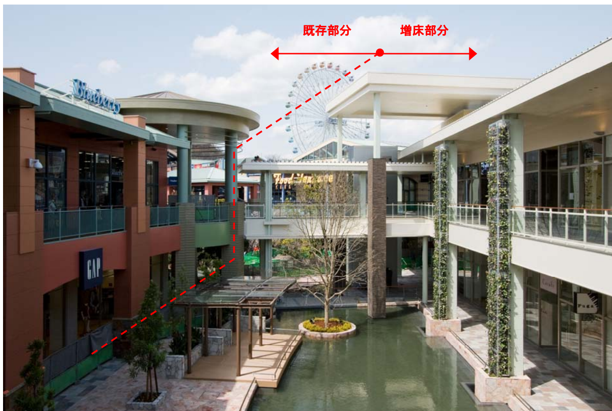
【資料4】増床部分の外観写真