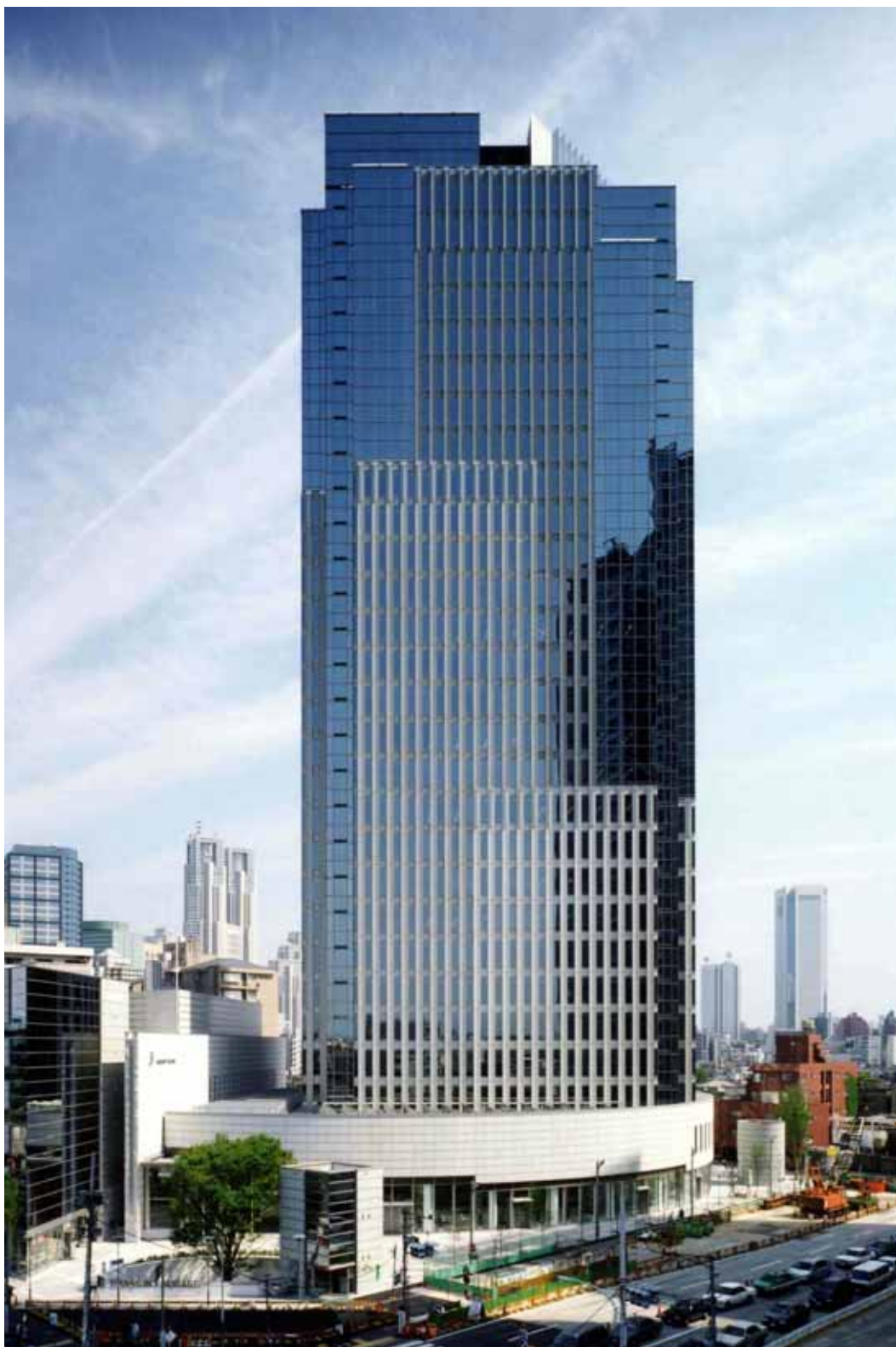
(参考)ハーモニータワー外観写真