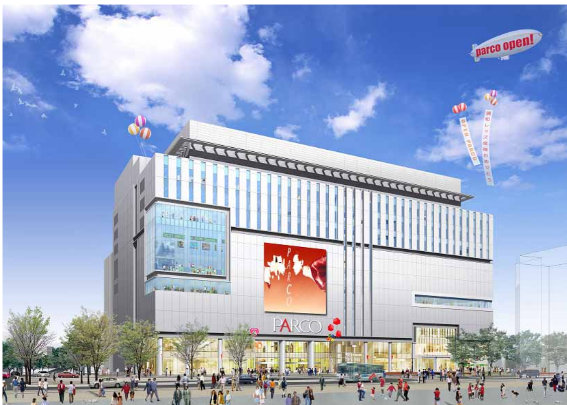
【本物件の外観イメージ図】