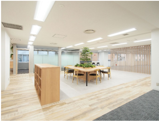
パブリックスペース①