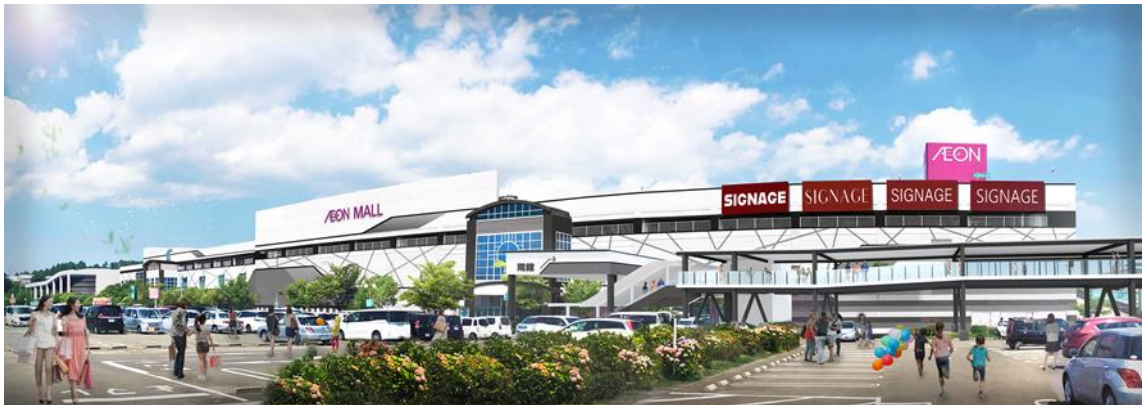
*画像はイメージであり、実際とは異なることがあります