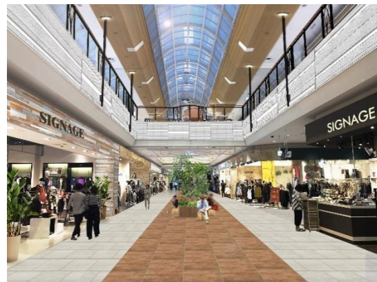
*画像はイメージであり、実際とは異なることがあります