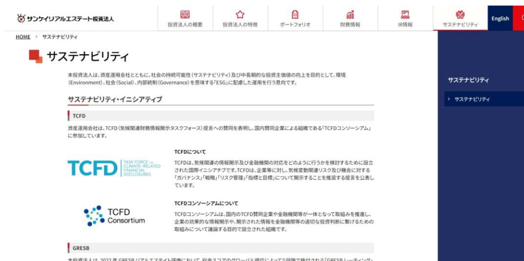
サステナビリティページの冒頭部分

サステナビリティに関する専用ページを新設し、本投資法人は資産運用会社とともに社会の持続可能性（サステナビリティ）及び中長期的な投資主価値の向上を目的として、今後はこちらのページにて情報開示の充実を図ります。