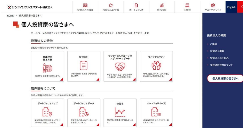
「個人投資家への皆さまへ」のページの冒頭部分

「個人投資家の皆さまへ」のページ以外のページにつきましても、説明文に図解を織り交ぜ、個人投資家の皆さまへわかりやすさを追求しました。