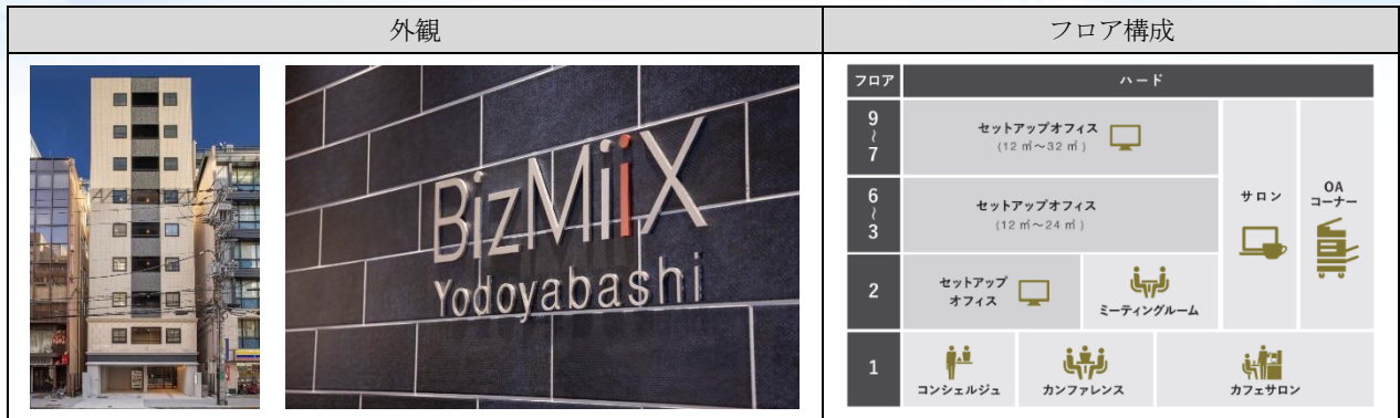
コワーキングカフェサロン (1階)