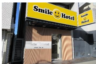
スマイルホテル大阪天王寺 (本投資法人保有物件)