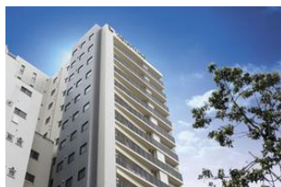
ホテルウィングインターナショナル セレクト上野・御徒町 (本投資法人保有物件)