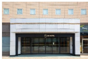
EN HOTEL Akita (本投資法人保有物件)