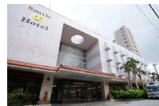
スマイルホテル那覇シティリゾート (本投資法人保有物件)