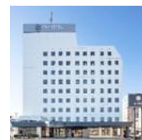
EN HOTEL Ise (本投資法人保有物件)