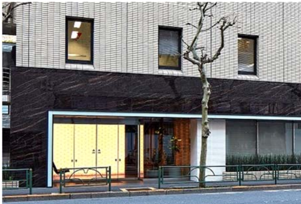
ライン照明を組み込んだエントランス