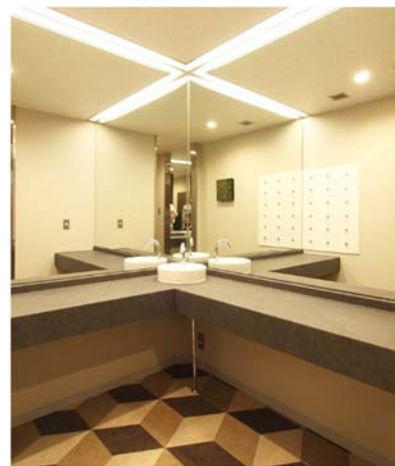
パウダーコーナー