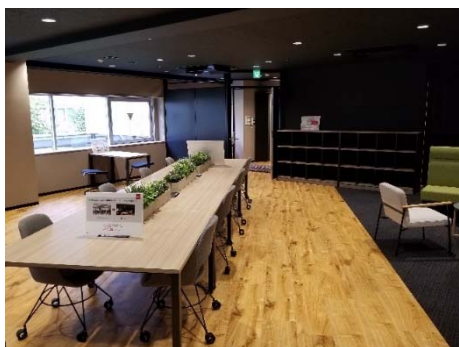
レイアウト変更に対応した可動式什器を採用