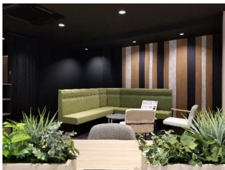
リラックスできるワークキングスペース