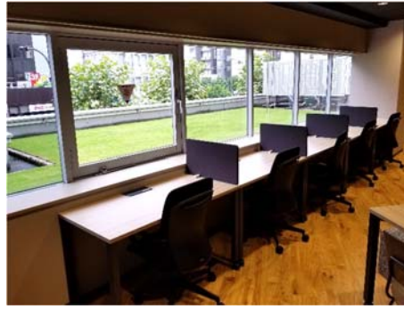
窓面を利用したワークキングスペース