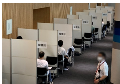
【ワクチン接種ブース】