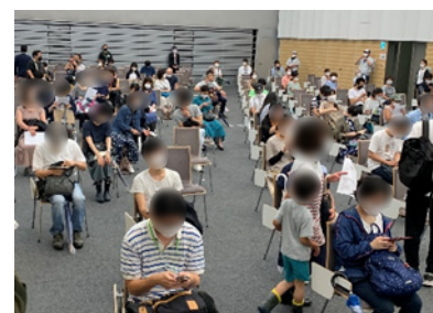
【接種後待機スペース】