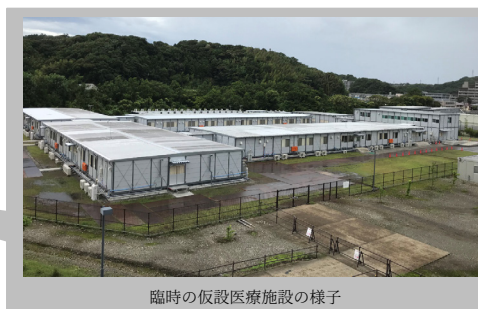
臨時的仮設医療施設の様子