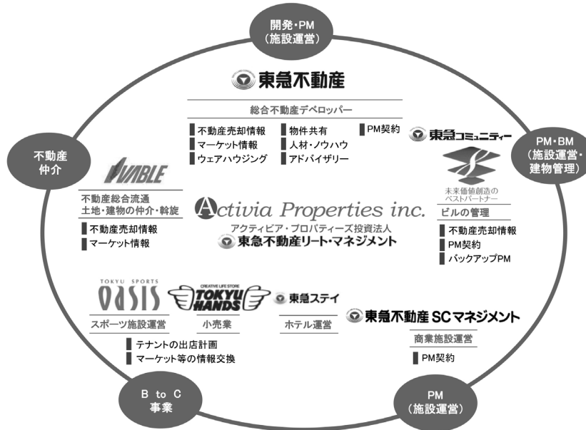
<東急不動産ホールディングスグループのバリューチェーン概念図>

以下は、東急不動産ホールディングスグループのバリューチェーンの概要を概念的に図示したものです。