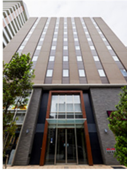
ホテルウイング インターナショナル神戸新長田駅前 (本投資法人保有ホテル)