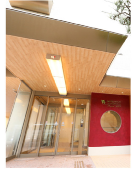
ホテルウイング インターナショナルプレミアム 金沢駅前