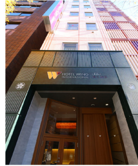
ホテルウイング インターナショナルセレクト 浅草駒形