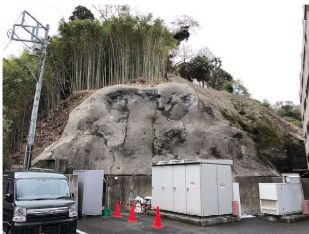
(2) 本物件 東側の急傾斜地を撮影 工事実施前