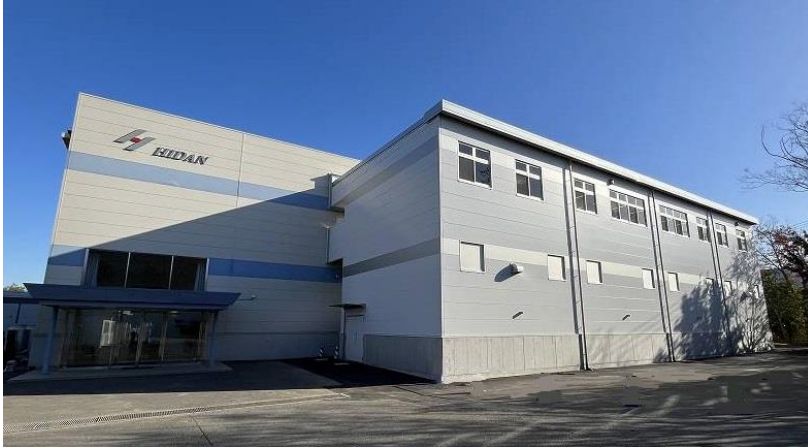
参考資料1 船橋ハイテクパーク工場I 写真