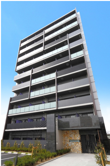
A-84 S-RESIDENCE 浄心 II