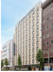
コンフォートホテル 浜松 (本投資法人保有ホテル)