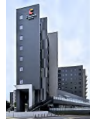
コンフォートホテル 名古屋金山