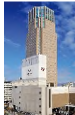
ホテルエミシア 札幌