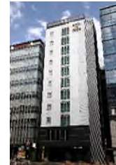
スマイルホテル 品川泉岳寺駅前