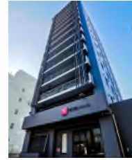
ホテルウィング インターナショナル 高松