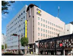
スマイルホテル長野 (本投資法人保有ホテル)