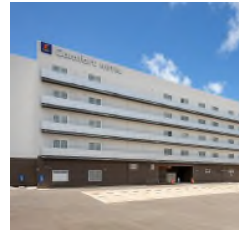
コンフォートホテル 石垣島