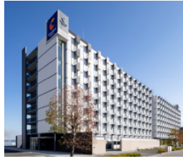
コンフォートホテル 中部国際空港 (本投資法人保有ホテル)