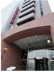
ホテルウィング インターナショナル 名古屋 (本投資法人保有ホテル)