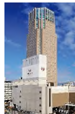
ホテル エミシア 札幌