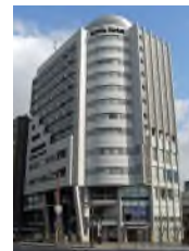
スマイルホテル 大阪四ツ橋