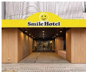
スマイルホテル 東京阿佐ヶ谷 (本投資法人保有ホテル)