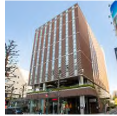
ホテルウィング インターナショナル プレミアム渋谷