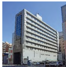
スマイルホテル京都四条 (本投資法人保有ホテル)