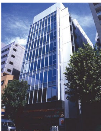
東五反田 1 丁目ビル