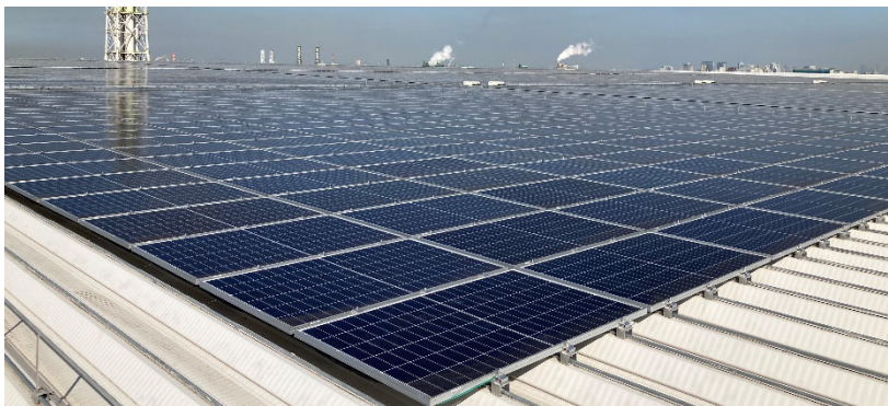
【本スキームによる外部購入電力低減のイメージ】

本物件においては、全館LED照明や人感センサー等の採用により、使用電力量の低減を図っているほか、本投資法人として初めて、屋根に設置されている太陽光パネルにより発電された電力を、施設内で使用される電力に充当する、再生可能エネルギーの自家消費スキーム（以下「本スキーム」といいます。）を導入していること等が評価されました。本スキームにより外部から購入する電力を低減させることで、本物件におけるCO2排出量の削減に寄与する予定です。